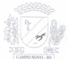
PEDRO DOS SANTOS PREFEITO DE CAMPO NOVO/RS

Aos 17 dias do mês de novembro do ano de 2022.