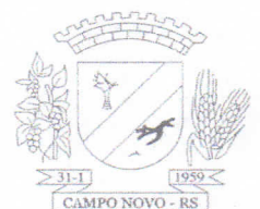
Pedro dos Santos Prefeito Municipal

GABINETE DO PREFEITO MUNICIPAL DE CAMPO NOVO-RS, AOS 20 DIAS DO MÊS DE OUTUBRO DE 2022.